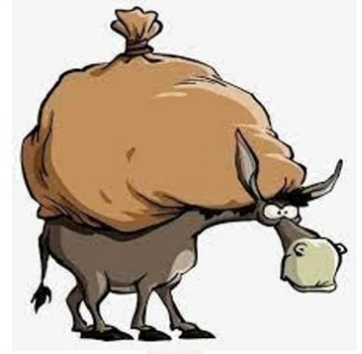
الحمار حمل الاثقال