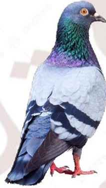
الحمام تنفعنا بلحمها وبيضها