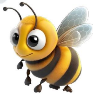
النحلة تنفعنا بالعسل