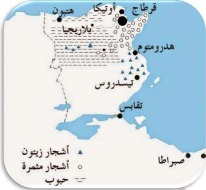
خارطة الناطق الفلاحية لأفريقيا الرومانية

لقد انعكس الازدهار الفلاحي على الصناعة والتجارة، فظهرت المعاصر، وتطورت صناعة الفخار التي يُنقل فيها المنتج الفلاحي أو يخزن فيه، وازدهرت صناعة الغزل. ونشطت المواني بأفريقيا الرومانية بتصدير الحبوب والزيتون.