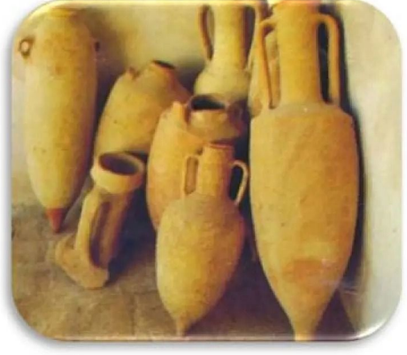
أواني خزفية لنقل المنتجات الفلاحية أو تخزينها