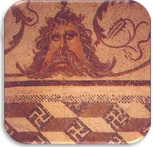
لوحة من الفسيفساء