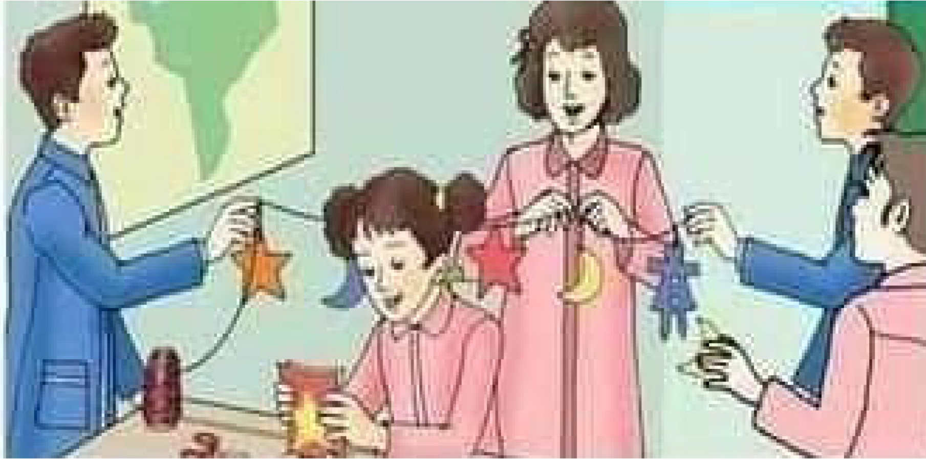
Les élèves fabriquent des guirlandes